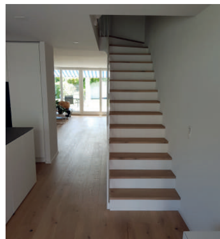
Die perfekte Lösung für Einfamilienhaus oder Villa

Silkwalk will Menschen ansprechen mit einer Vision. Menschen, die eine Idee für ihr Eigenheim oder die neu zu gestaltenden Büros haben und das Besondere, das Edle suchen. Beim Glattbruggener Unternehmen werden sie fündig, da werden Wohnträume wahr. Kunden werden sehr kompetent beraten und professionell zum Ziel und darüber hinaus begleitet. Im Fall von Silkwalk neben aller Professionalität einfach Ehrensache und die perfekte Grundlage für langjährige Kundenbindung.