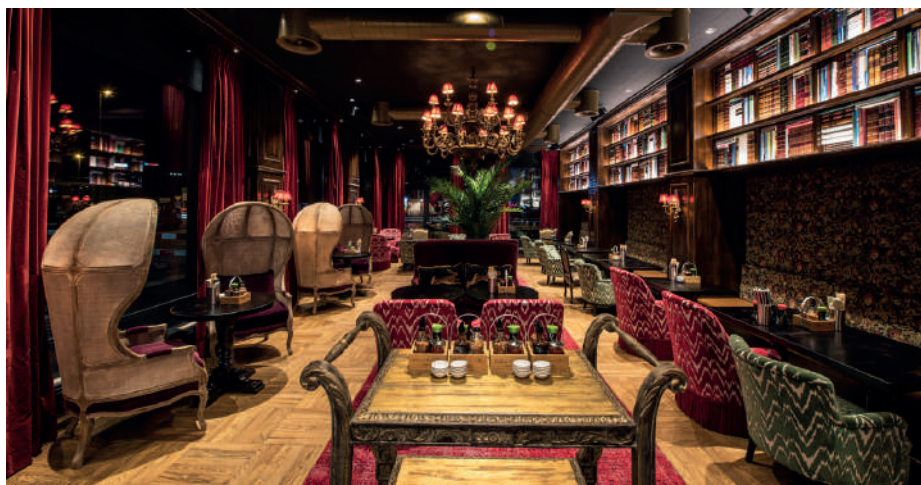
Ein gutes Beispiel für Silkwalk: Die Nooch-Filiale in Kriens.