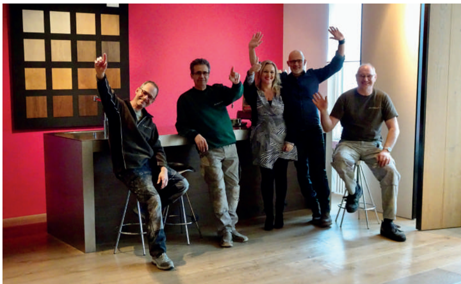
Kompetente Partner: das Silkwalk-Team